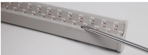
Klemmenabstand terminal spacing